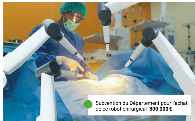
Subvention du Département pour l'achat de ce robot chirurgical : 300 000 €

Notre article « Le Département au chevet de la santé » sur essonne.fr