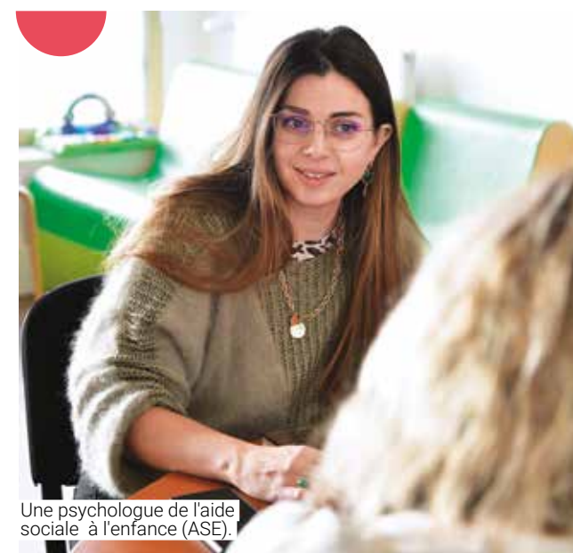
Une psychologue de l'aide sociale à l'enfance (ASE).