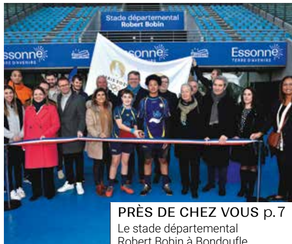
PRÈS DE CHEZ VOUS p.7 Le stade départemental Robert Bobin à Bondoufle prêt pour les JO de Paris 2024.