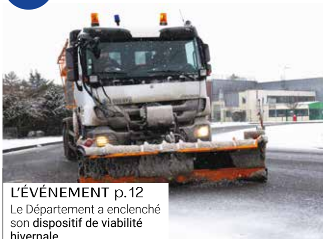
L'ÉVÉNEMENT p.12 Le Département a enclenché son dispositif de viabilité hivernale.