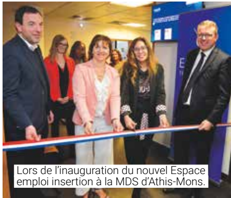
Lors de l'inauguration du nouvel Espace emploi insertion à la MDS d'Athis-Mons.