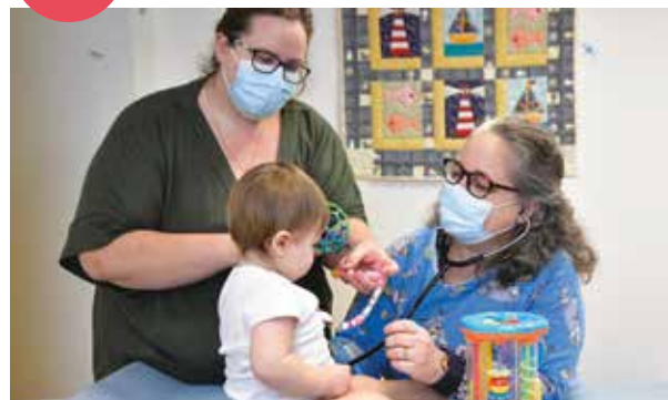
LE DOSSIER p.14 Médecins, puéricultrices, cuisiniers ou coachs emploi... Plus de 4 000 agents en Essonne assurent au quotidien le service public départemental.