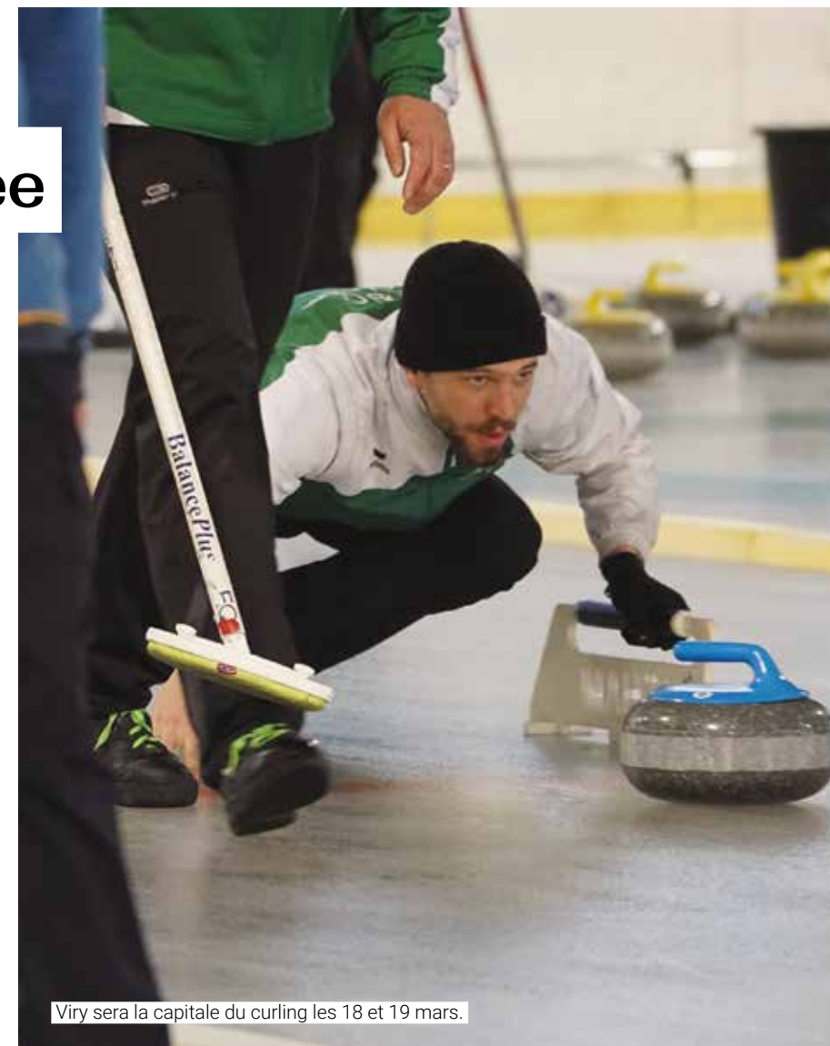
Viry sera la capitale du curling les 18 et 19 mars.

+ d'infos sur curlingvirychatillon.jimdofree.com