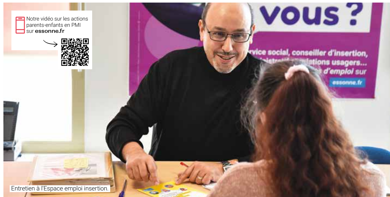
Entretien à l'Espace emploi insertion.