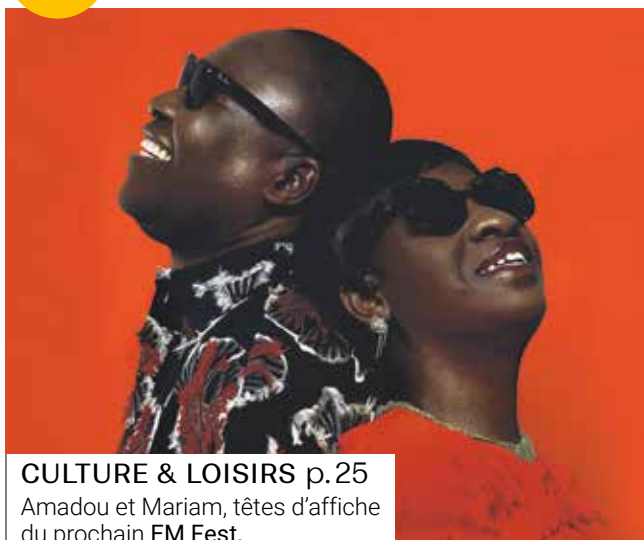
CULTURE & LOISIRS p.25 Amadou et Mariam, têtes d'affiche du prochain EM Fest.