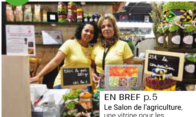
EN BREF p.5 Le Salon de l'agriculture, une vitrine pour les producteurs essonnais.